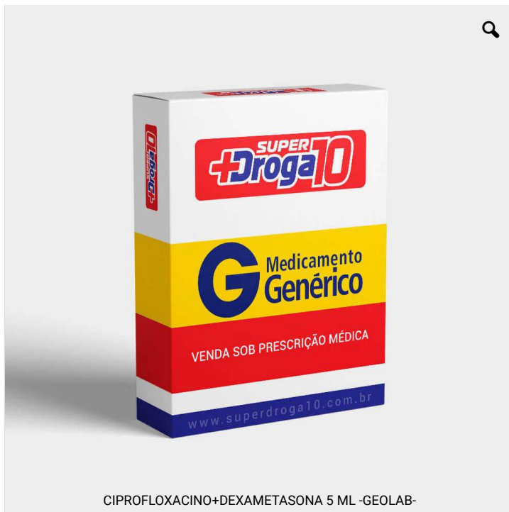
CIPROFLOXACINO+DEXAMETASONA 5 ML -GEOLAB-