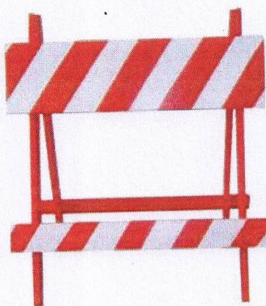
Cavalete de Sinalização padrão CET/SP

Deverá conter a inscrição DIV. TRÂNSITO P. M. CAJATI/SP gravada na barra superior.