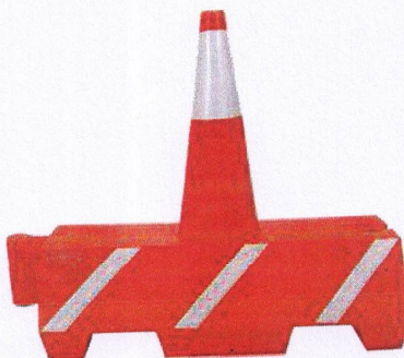
Barreira Cone em material plástico para Sinalização Viária

Deverá conter a inscrição DIV. TRÂNSITO P. M. CAJATI/SP gravada na barra superior.