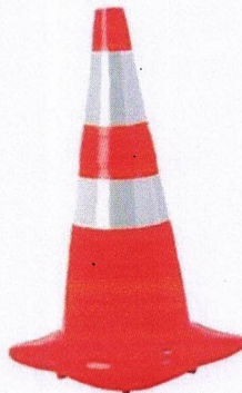
Cone de Sinalização Viária padrão ABNT NBR 15.071

Deverá conter a inscrição DIV. TRÂNSITO P. M. CAJATI/SP abaixo da faixa inferior.