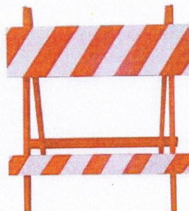
Cavaleta de Sinalização padrão CET/SP

Deverá conter a inscrição DIV. TRÂNSITO P. M. CAJATI/SP gravada na barra superior.