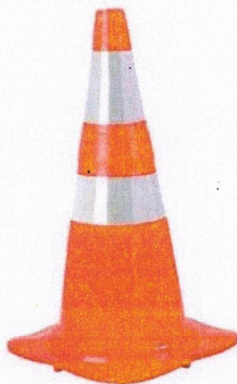
Cone de Sinalização Viária padrão ABNT NBR 15.071

Deverá conter a inscrição DIV. TRÂNSITO P. M. CAJATI/SP abaixo da faixa inferior.