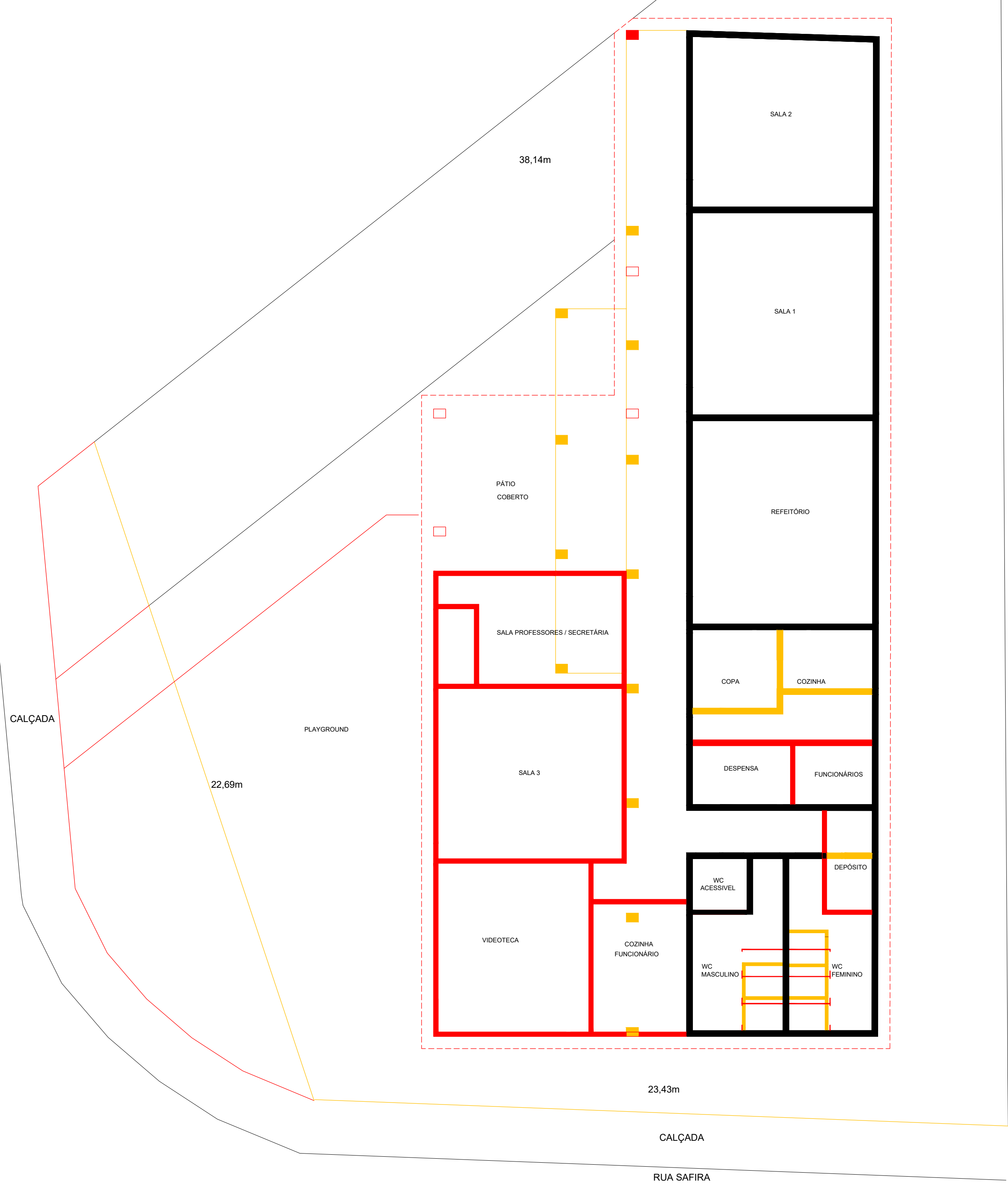
PLANTA DE MODIFICAÇÕES