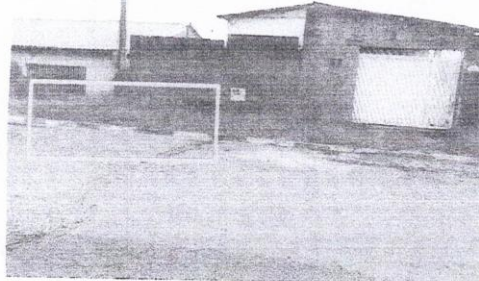
c) Local recomendado para execução da boca de lobo. Residência da Requerente localizada logo a esquerda.