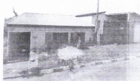
d) Casa da Requerente foi executada abaixo do nível da Rua.