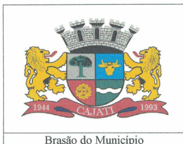
Brasão do Município