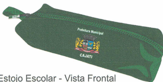
Estojo Escolar - Vista Frontal

Aplicar o Brasão e o Texto "Prefeitura Municipal de CAJATI" conforme abaixo.