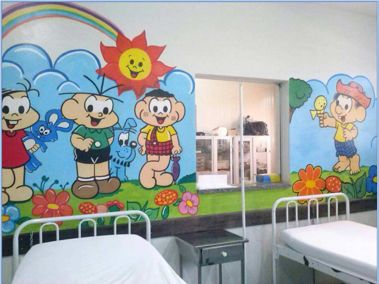
LOTE 01 (modelo)