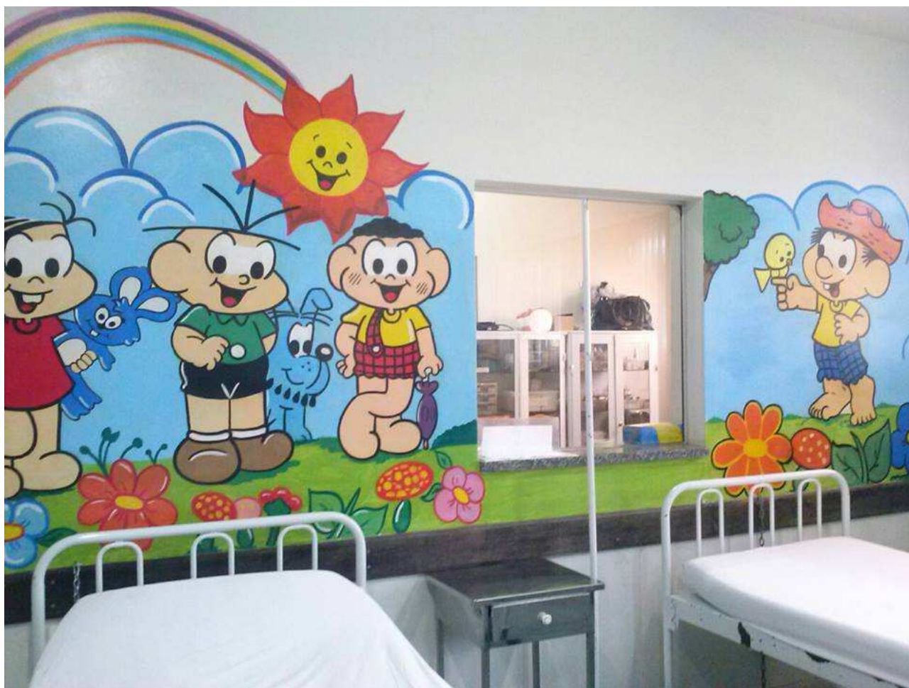
LOTE 01 (modelo)