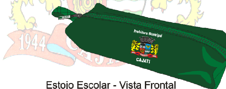
Estojo Escolar - Vista Frontal

Aplicar o Brasão e o Texto "Prefeitura Municipal de CAJATI" conforme abaixo.