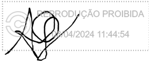
ALEXANDRE GULIN 08 abr 2024, 11-44-54.png

Assinatura manuscrita com hash SHA256 prefixo 203312(...)